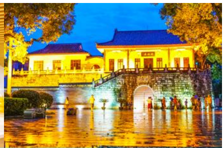
ประตูโบราณกุ๋หนานเหมิน