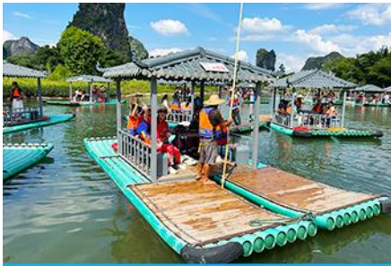
ขั้วเรือแพชมแม่น้ำหลีเจียง