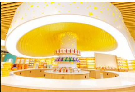
พิพิธภัณฑ์ดอกกุ้ยฮวา