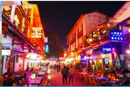
ถนนคนเดิน ซิเจียหรือถนนฝรั่ง