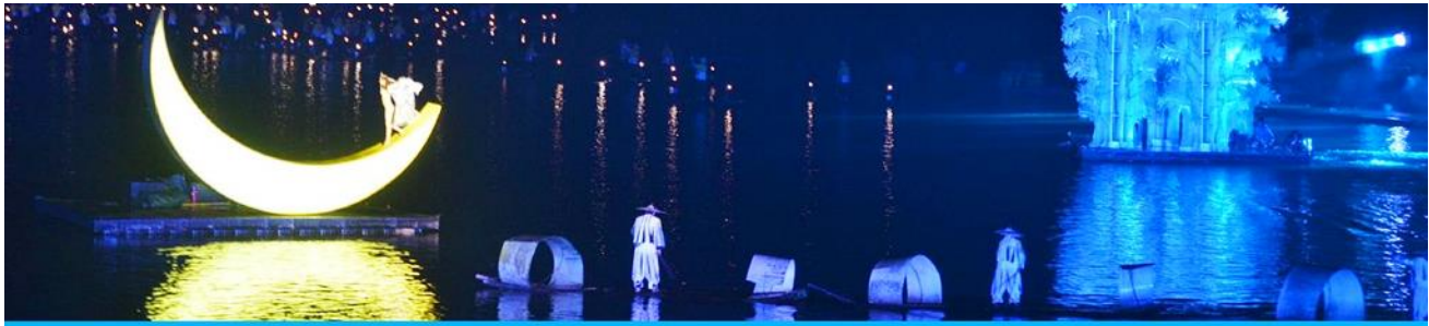
The Impression of Liu Shan Jie