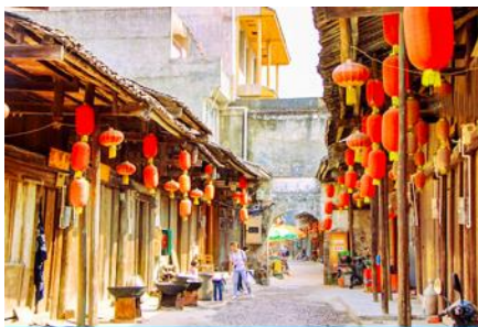
เมืองโบราณต้าชวี

พักที่ HAO YUAN INTER HOTEL ระดับ 4 ดาวท้องถิ่นหรือเทียบเท่าใน เมืองหยางซัว