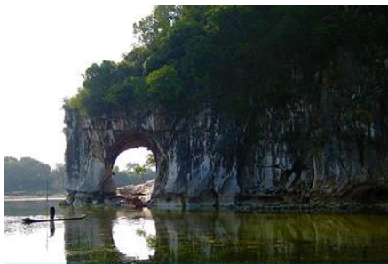
เขาวงช้าง

พักที่ GUILIN JINYI HOLIDAY HOTEL โรงแรมระดับ 4 ดาวท้องถิ่น หรือเทียบเท่าในเมืองกุ้ยหลิน