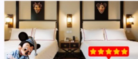
พิก Disney Explorers Lodge 5 ดาว 1 คืน