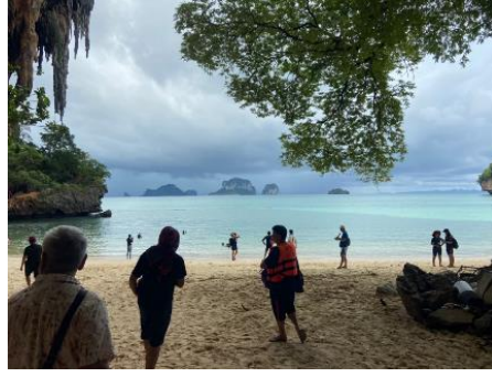
ถ่ายรูปเกาะไก่ ลงเล่นน้ำ เกาะไก่ ชมปะการังหลากสี ปลาการ์ตูน และ ปลานานาชนิด