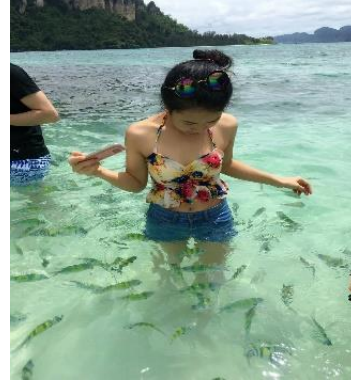
ชมทะเลแหวก Unseen in Thailand เชื่อมระหว่าง เกาะทับ และ เกาะหม้อ