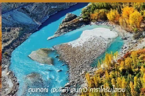
ดอยท้อ (ดงโศก) เส้นทาง คาราโครัมไฮเวย์