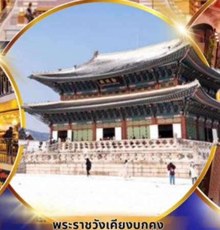
พระราชวังเคียงบกคุง