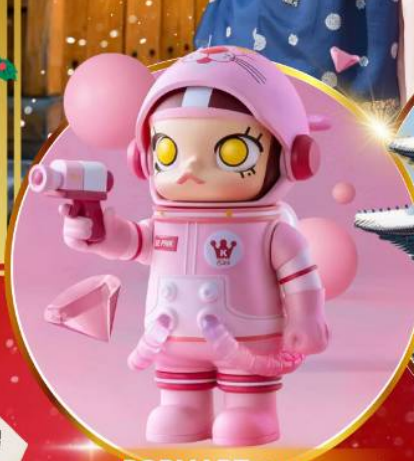
POP MART ฮงแด