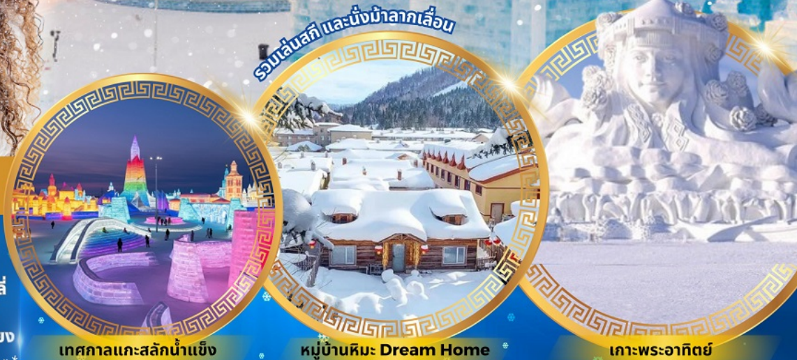
เทศกาลแกะสลักน้ำแข็ง

จตุรัสโบสถ์เซินโซเฟีย ถนนจงยง หมู่บ้านหิมะดินแดนมหัศจรรย์ อนุสาวรีย์ฝังหกง สนุกสนานกับลานสกียาปูลี ถนนแฉ่ยูนเจีย เขาแกะหญา เขาปังจย ภาพเขียน Ice and Snow แม่น้ำซงฮัวเจียง โซวี่ว้ายน้ำแข็ง เกาะพระอาทิตย์