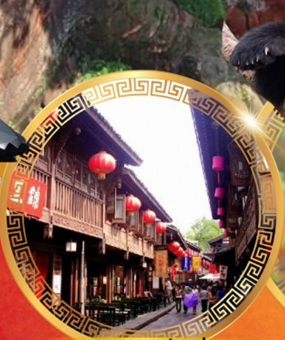
ถนนโบราณจีนหลี่

ล่องเรือชมวิหารพระหลวงพ้อโตเล่อชาน สักการะพระโพธิสัตว์ผู้เสียน เขาจ้อไบ๋ ย่อนเวลาชมถนนจีนโบราณ ชมความน่ารักของหมีแพนด้า ชมความยิ่งใหญ่ แสงสียามค่ำคืน สักการะ วัดต้าเจ้อ กว่า1600ปี อิสระช้อปบิงตึก IFS