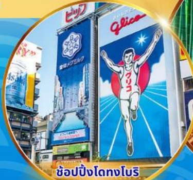
ช้อปปิ้งโตงโบริ