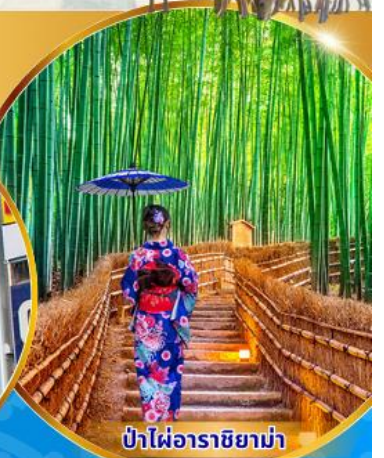
ป่าไฟอาราชิยาม่า

พักโรงแรม 3ดาว เกียวโต 1คืน โอซาก้า 2คืน