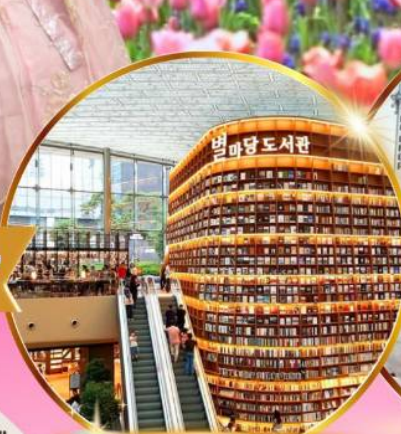
ห้องสมุดสตาร์ฟิลด์