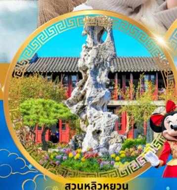
สวนหลิวหยวน