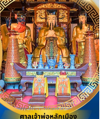
ศาลเจ้าพ่อหลักเมือง