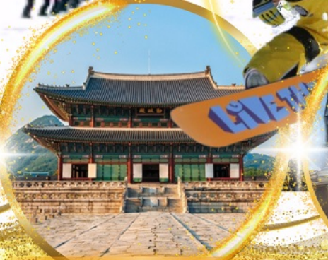
พระราชวังเคียงบกกรุง