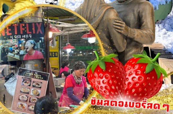
ตลาดกวางจง