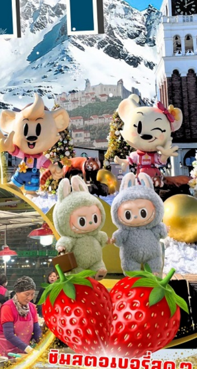
ป้อมฮวาซอง