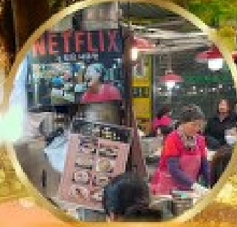
สตรีทฟู้ดตลาดกวางจ็อง

สนุกสุดเหวี่ยงกับกิจกรรมขบวน LUGE !! พิเศษ !! นั่งกระเช้าชมวิว 360° เมืองคังฮวา