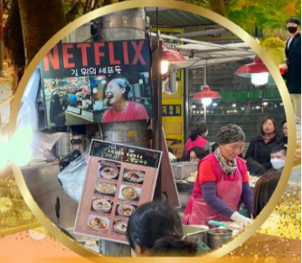
สตรีทฟู้ดตลาดกวางจ้ง