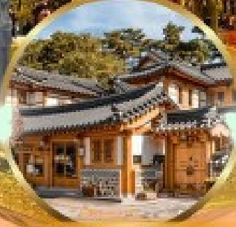
หมู่บ้านโบราณอินช็อง