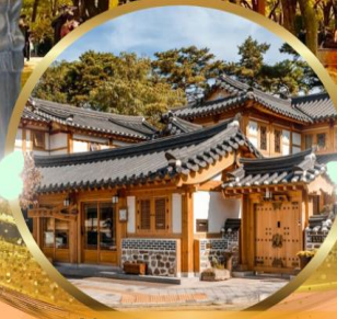
หมู่บ้านโบราณอินพยอง