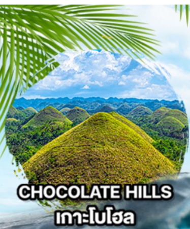
CHOCOLATE HILLS เกาะโมโฮ