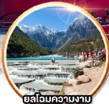
ยลโฉมความงาม