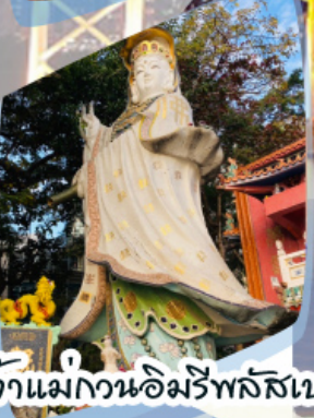
เจ้าแม่กวนอิมรีพลัสเบง