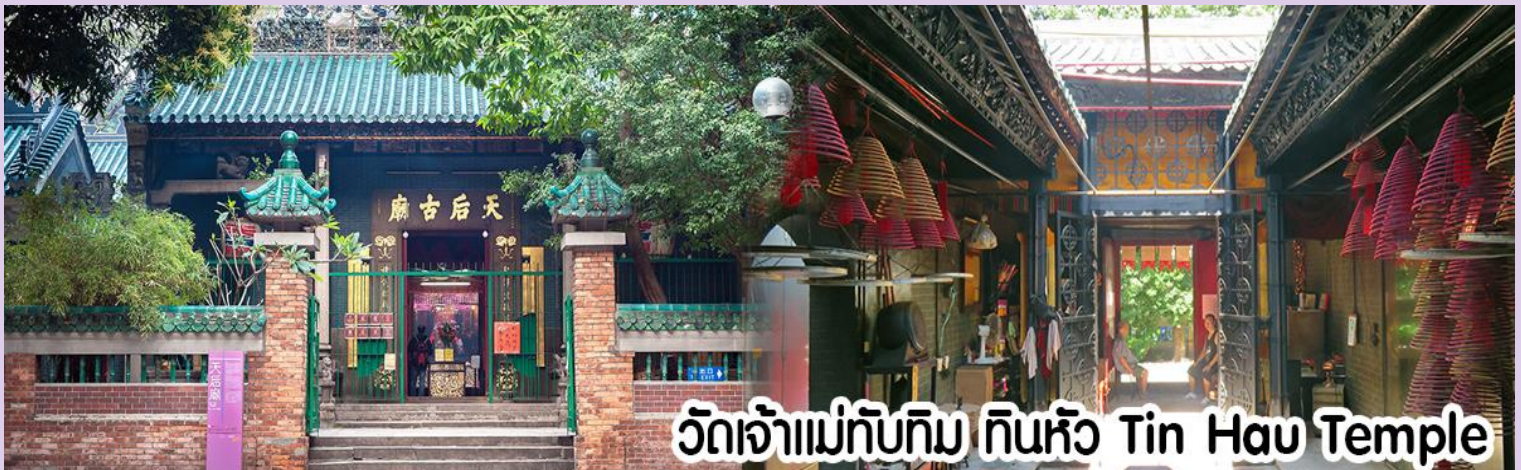
วัดเจ้าแม่ทับทิม ทินหิว Tin Hau Temple

นำทุกท่าน ไหว้ศาลเจ้าแม่ทับทิม ทินหิว (Tin Hau Temple) เป็นวัดเก่าแก่และสำคัญอีกวัดหนึ่งของฮ่องกง เพราะในสมัยก่อน ฮ่องกงเป็นเพียงหมู่บ้านชาวประมง ซึ่งเคารพนักคือเจ้าแม่ทับทิมว่าเป็นเทพีแห่งท้องทะเล เพื่อให้เดินทางปลอดภัย เวลาออกไปทำงานไกลๆ หรือออกหาปลา นอกจากการมาสักการะบูชาเจ้าแม่ทับทิมในเรื่องของการเดินทางให้ปลอดภัยแล้ว ไฮไลท์สำคัญอีกอย่างหนึ่งของวัดเจ้าแม่ทับทิม ทินหิว (Tin Hau Temple) จะเป็นขดรูปสี่แดงขนาดใหญ่ ที่แขวนอยู่ตามเพดานด้านในของวัดก็จะเป็นสกาปัตยกรรมแบบวัดจีน สร้างขึ้นตั้งแต่ปี ค.ศ. 1876 โดยทางเข้าของวัดจะอยู่ติดกับสวนสาธารณะเล็ก ๆ ที่มีต้นไม้ใหญ่หลายต้น ให้บรรยากาศร่มรื่น