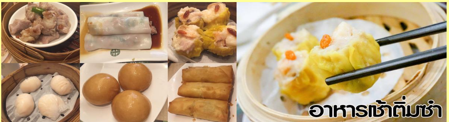
อาหารเช้าต้มซำ