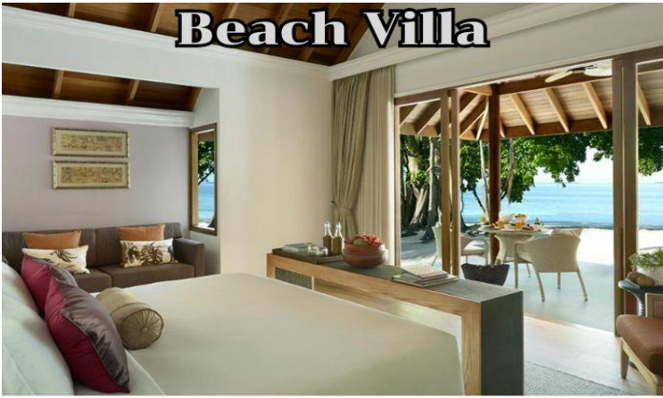
Deluxe Beach Villa with Pool