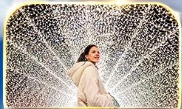
ชมงานประดับไฟนารานา โนะ ซาโตะ