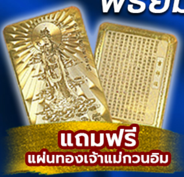
แถมฟรี แผ่นทองเจ้าแม่กวนอิม