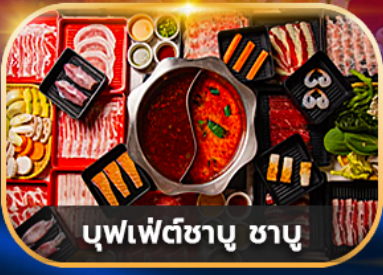
บุฟเฟ่ต์ซาบู ซาบู