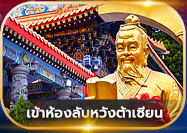
เข้าห้องลับหวังต้าเซียน