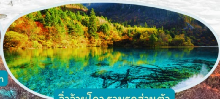
จิวจ้ายโกว รวมรถส่วนตัว