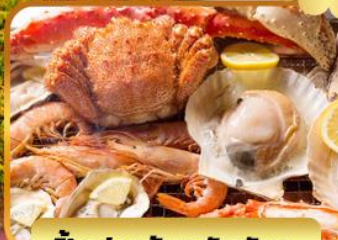
ปิ้งย่างร้านดังมันดะ