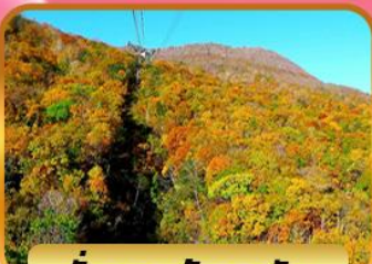
นั่งกระเช้าอุซุซัง