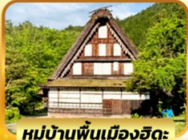
หมู่บ้านพื้นเมืองฮิดะ