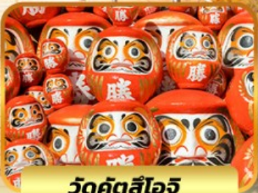
วัดคัตสึโงจิ