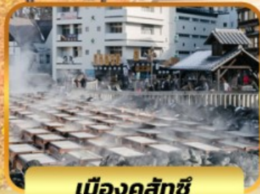
เมืองคุสัทซึ