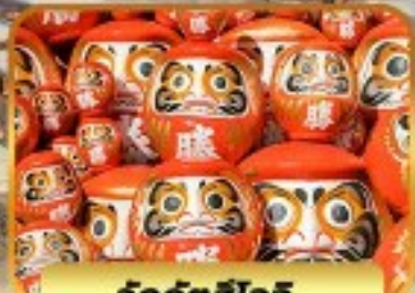
วัดคังสึโงอิ