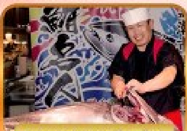
ตลาดปลาคุโรชิโอะ