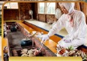
เมนู AMA HUT