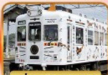
นั่งรถไฟทามะจิง