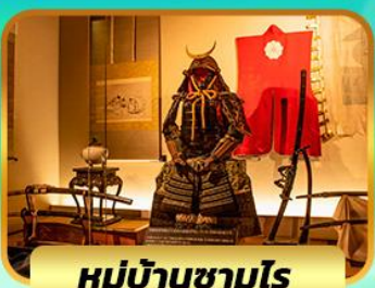
ห่มุบ้านซามูโร