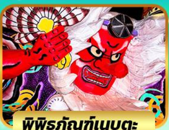
พีพีรภัณ์ท้เบบูตะ