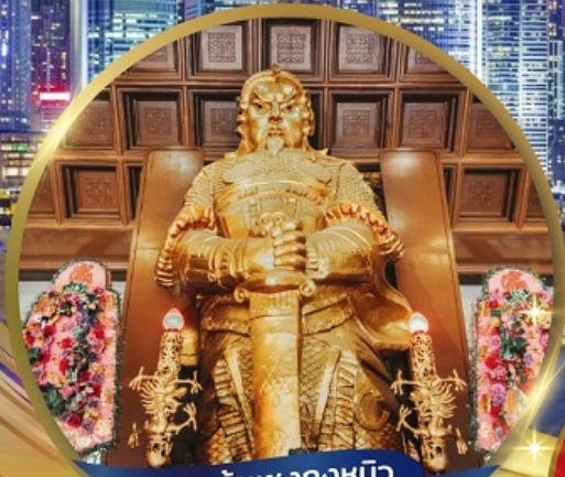
เทพเจ้าเซ่งกวงหมิว (วัดเซ่งกวงหมิว)