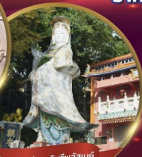
เจ้าแม่กวนอิมพรสิลเบย์