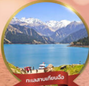
ทะเลสาบเทียนฉือ