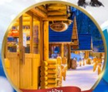
หมู่บ้าน NINGLE TERRACE

สนุกสนาน ณ ลานสกี • หมู่บ้านราเมนอาซาฮิคาว่า • หมู่บ้านนิงเกิลเทอเรส ขบวนพาเหรดเพนกวิน ณ สวนสัตว์อาซาฮิคาว่า • โรงงานช็อกโกแลต โอดารุ • ศาลเจ้าฮอกไกโด • พระใหญ่ HILL OF BUDDHA