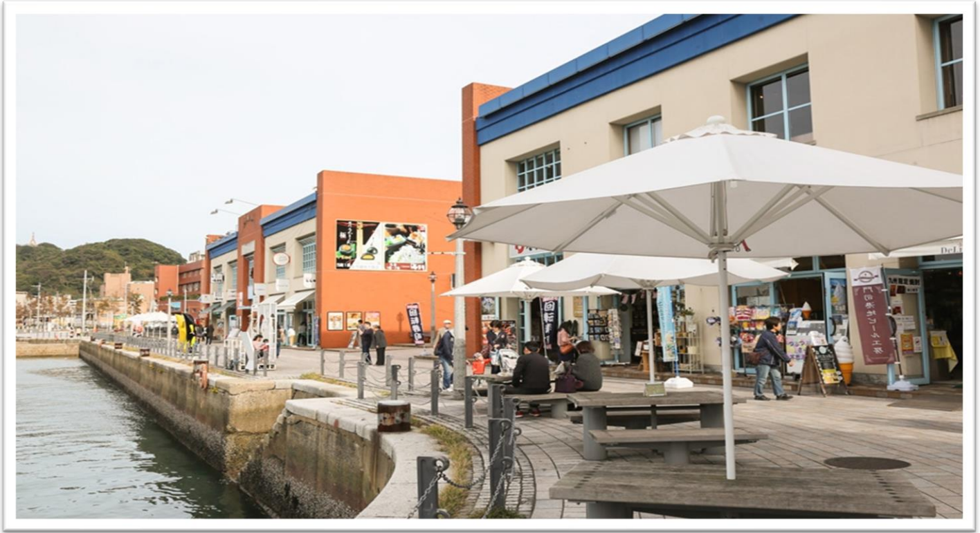
รับประทานอาหารค่ำ ณ ภัตตาคาร

นำท่านสู่ ไคเคียวพลาซ่า เปิดทำการในปี 1999 เป็นComplexเชิงพาณิชย์ที่มีคอนเซ็ปต์ "ตลาดที่เต็มไปด้วยความโรแมนติกชั้นหนึ่งเป็นตลาดที่มีสินค้ามากมาย เช่น ของที่ระลึกราคาโรงงาน อาหารทะเลในท้องถิ่น สินค้าทั่วไป และของหวาน ชั้นสองเป็นร้านอาหารทะเลสดใหม่จากช่องแคบKanmon มีวิวที่ยอดเยี่ยม รวมถึงร้านกล่องดนตรี และร้านตุ๊กตาแก้ว