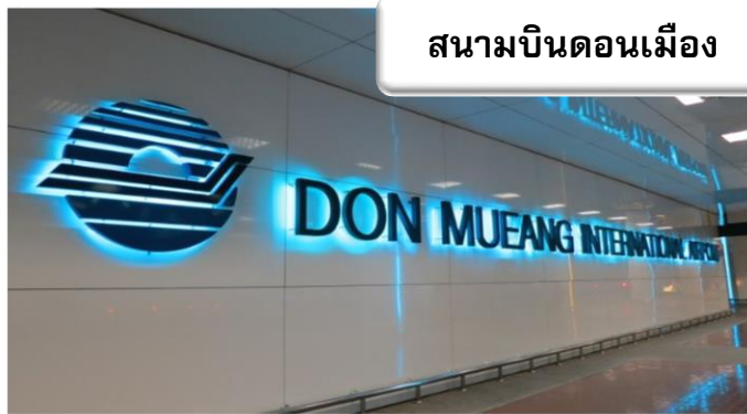
สนามบินดอนเมือง

เวลา 20.30 น. พร้อมกันที่ ท่าอากาศยานดอนเมือง อาคารผู้โดยสารขาออกระหว่างประเทศ เคาน์เตอร์สายการบินไทยแอร์เอเชีย เจ้าหน้าที่คอยให้การต้อนรับดูแลด้านเอกสาร เช็คอิน และสัมภาระในการเดินทาง เวลา 23.25 น. ออกเดินทางสู่ สนามบินฟุกุโอกะ ประเทศญี่ปุ่น โดยสายการบินไทยแอร์เอเชีย เที่ยวบินที่ FD 236