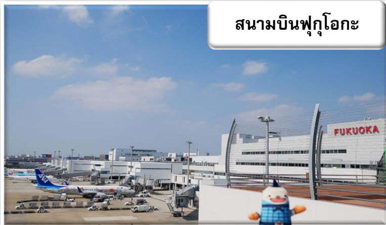
สนามบินฟุกุโอกะ

เวลา 07.05 น. เดินทางถึง สนามบินฟุกุโอกะ ประเทศญี่ปุ่น นำท่านผ่านขั้นตอนการตรวจคนเข้าเมืองและศุลกากร