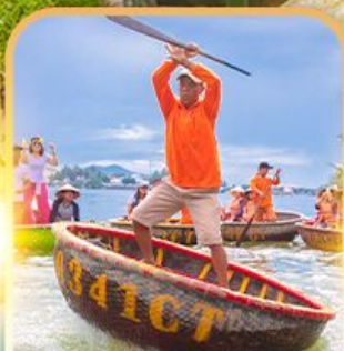
เรือกระด้ง