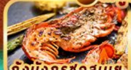
กุ้งมังกรชอสนาย