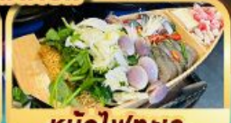
หม้อไฟทะเล