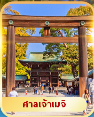
ศาลเจ้าเมจิ