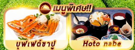
บุฟเฟ่ต์ซาบู่