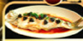
ปลาประธาราหรับดี