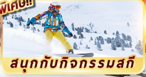
สนุกกับกิจกรรมสกี