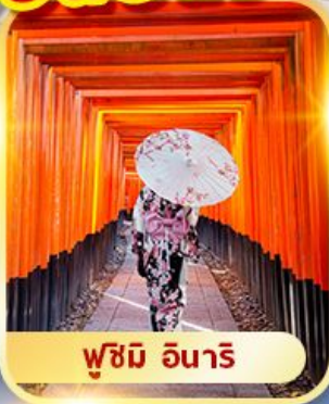
ฟูชิมิ อินาริ