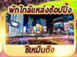
พักใกล้แหล่งช้อปปิ้ง ซิเหมินตง