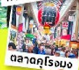
ตลาดคุโรมง