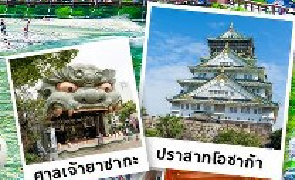
ศาลเจ้าฮาซากะ