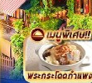
เมนูพิเศษ!! พระกระโดดกำแพง