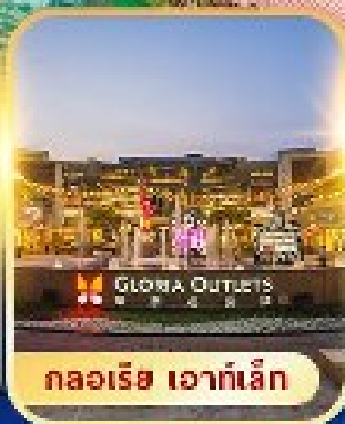
กลอเรีย เอาท์เล็ต