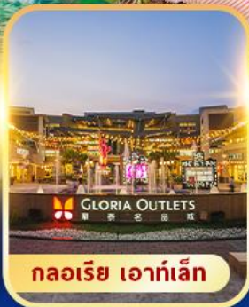
กลอเรีย เอาท์เล็ต