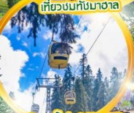
กระเช้า gondolà 360 องศา