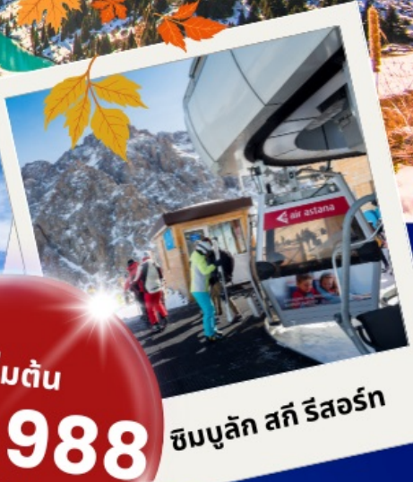
ซิมบูลัก สกี รีสอร์ท