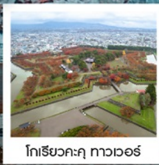
โทริยกะคุ ทาวเวอร์

PERIOD 1 : 21 - 26 ต.ค. 67 | PERIOD 2 : 23 - 28 ต.ค. 67