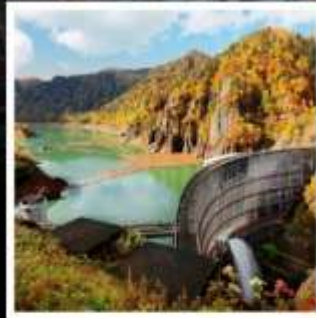
สันเขื่อนโฮเฮเคียว