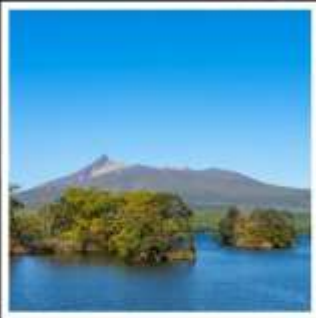
อุทยานแห่งชาติโอनुมะ