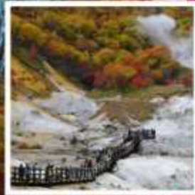
หุบเขานรก จิโคะคุดาบิ