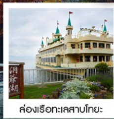
ล่องเรือทะเลสาบโทยะ