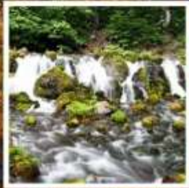
สวนฟูจิตาชิพาร์ค