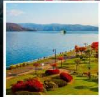
ล่องเรือชมทะเลสาบโทยะ

กระเช้าภูเขาฮาโกดาเตะ ชมวิวที่สวยงามที่สุด 1 ใน 3 ของญี่ปุ่น ระดับมิชลิน 3 ดาว ชมสวนฟูจิตาชิ 1 ในแหล่งน้ำที่สะอาดที่สุดจากยอดเขาโยเทอิ ถ่ายรูปไหนก็สวยงาม หุบเขานรก จิโคะคุดาบิ ชมบรรยากาศของแหล่งกำเนิดออนเซ็นชื่อดังที่สุดแห่งฮอกไกโด อุทยานแห่งชาติโอनुมะ กับทิวทัศน์ภูเขา และทะเลสาบ สุดแปลกตา สันเขื่อนโฮเฮเคียว มนต์เสน่ห์แห่งใบไม้เปลี่ยนสีที่รอคุณมาสัมผัส ล่องเรือกลางทะเลสาบโทยะ ท่ามกลางบรรยากาศใบไม้เปลี่ยนสี มนต์เสน่ห์ที่ต้องค้นหา พักออนเซ็น 2 คับ!!! / ชิปโปโร..พักใจกลางแหล่งช้อปปิ้ง 2 คับ อาหารพิเศษ...บุฟเฟ่ต์ซาบูยักซ์, บุฟเฟ่ต์ซาบู กรุ๊ปสบายๆ เพียง 20 ท่านเท่านั้น!!!