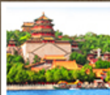
อวี่เหอหยวน