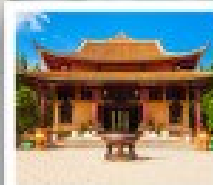
วัดจุกิน