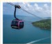
กระเช้าเหิน