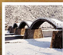
สะพานหินโตเกียว