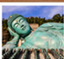
วัดนินโซอิน

วัดนินโซอิน / หมู่บ้านยูฟูอินฟลอริส / บ่อน้ำร้อนอุมิ จิโกกุ / ตลาดปลาคะระโตะ / สะพานหินโตเกียว / ศาลเจ้าอิตสึกุชิมะ ถนนสายช้อปปิ้งโอโมเตะซันโด / สวนอนุสรณ์สันติภาพอิโรชิมา / อะดอมนิคมอมบิโดม / ปราสาทอิโรชิมา / พิพิธภัณฑ์สัตว์น้ำทงงะฟุซาซากิ สวนริคิฮิโร / โทเป ซันดะ พรีเมียม เอาก์เค็ต / พิพิธภัณฑ์สัตว์น้ำมิฟูเอะ / อีซสะทงงะเกียวและช้อปปิ้ง