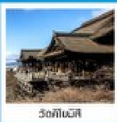
วัดโทอินจิ