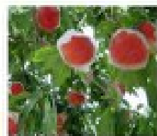
เก็บสุกพีระ