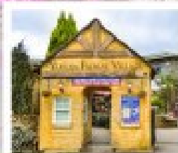
หมู่บ้านยูฟูจินฟลอร์ริส