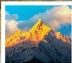
ภูเขาคิมะเท๋นเป่ย์